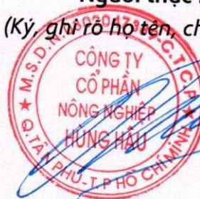
TỪ THANH PHỤNG

Người thực hiện CBTT (Ký, ghi rõ họ tên, chức vụ, đóng dấu)